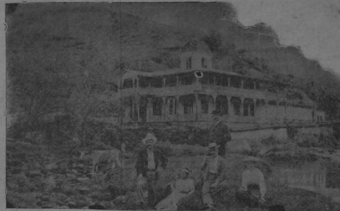
Baños en el río «Aguas Calientes», Cartago