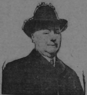
PHILANDER C. KNOX

La llegada de Mr. Knox es el ápice de todas las conversaciones, hoy en día, y la importancia de su visita á estas repúblicas reconocida por todos los que se cercan sigue la política internacional de los Estados Unidos, como un paso, tal vez de más trascendencia que el viaje de Ellhu Root en 1906 á la Argentina, Brasil y Chile.