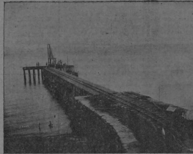
Muelle de la Compañía Minera de Manzanillo